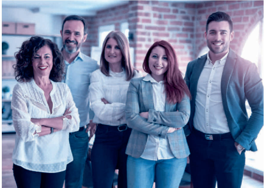
Alles klar: Das Personalreglement schafft eine verbindliche Regelung der Arbeitsbeziehung.

Grundlegender Bestandteil des Personalreglements ist das Arbeitszeitmodell des Unternehmens. Also beispielsweise die gleitende Arbeitszeit mit definierten Blockzeiten, Regelungen zum Homeoffice und die im Betrieb übliche Wochenar-